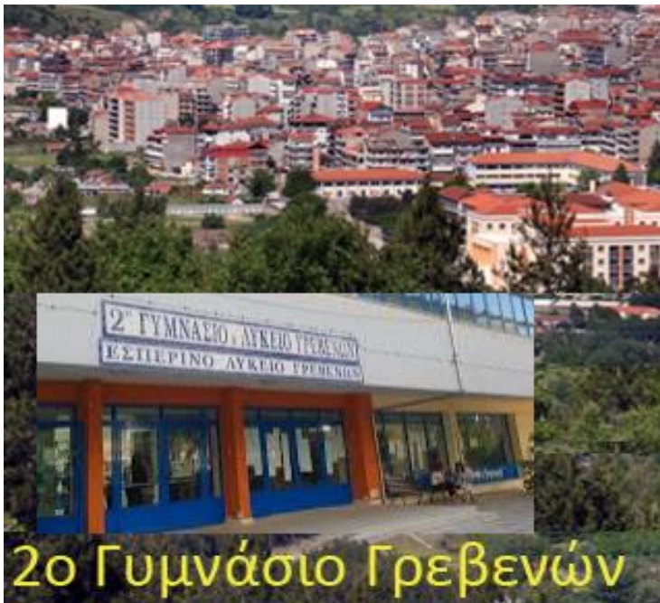
2ο Γυμνάσιο Γρεβενών